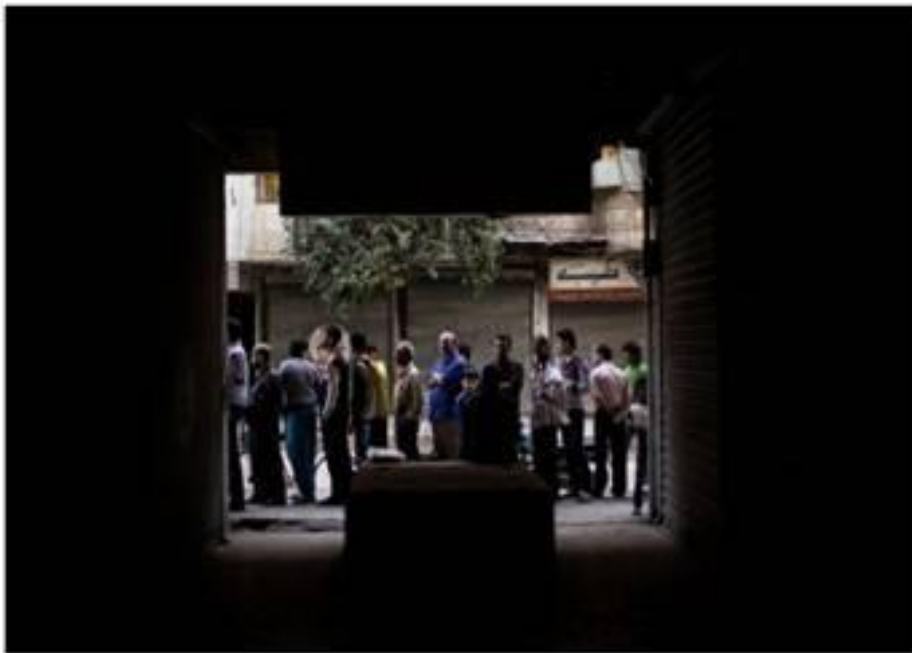
Un grupo de hombres hace cola para comprar pan el domingo en Alepo.

Archivado en: Primavera Árabe Bachar el Asad Siria Oriente próximo Revoluciones Guerra Conflictos políticos Asia Partidos políticos Conflictos Política