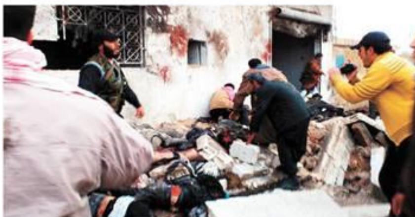
Halfaya. La localidad del centro de Siria sufre una crisis humanitaria ante la escasez de pan provocada por el cerco de las tropas de Al-Assad.

Más de 60 personas murieron ayer en un bombardeo aéreo sobre una panadería en Siria. El suceso coincide con la llegada del emisario de la Organización de Naciones Unidas (ONU) Lakhdar Brahimi, quien intenta de nuevo hallar una solución al conflicto.